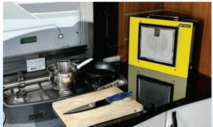
Im Wohnwagen / Wohnmobil