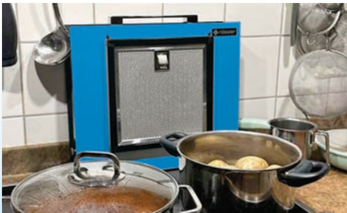
In der Küche zu Hause