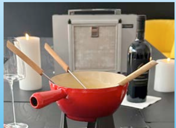
Am Tisch beim Grillen oder beim Fondue